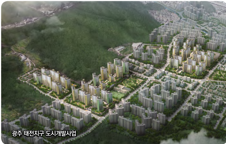
광주 태전지구 도시개발사업