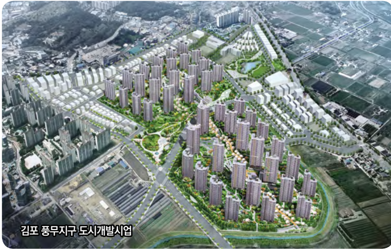
김포 풍무지구 도시개발사업