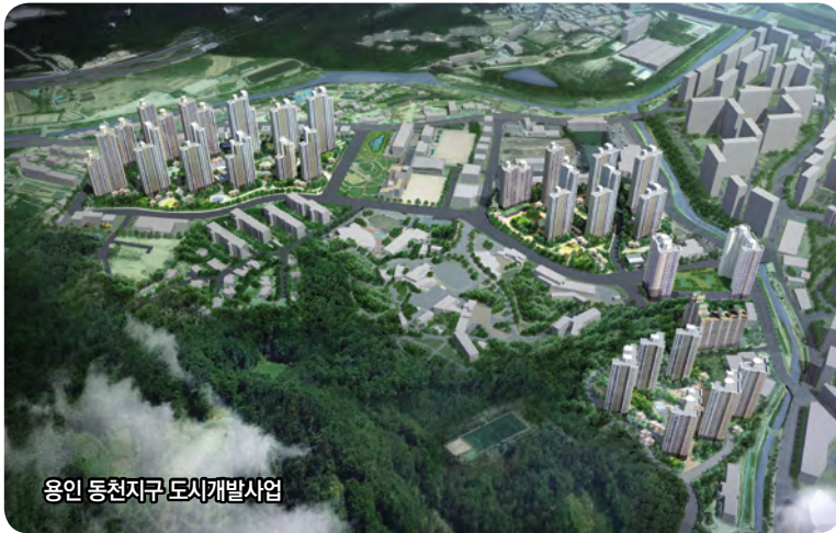
용인 동천지구 도시개발사업